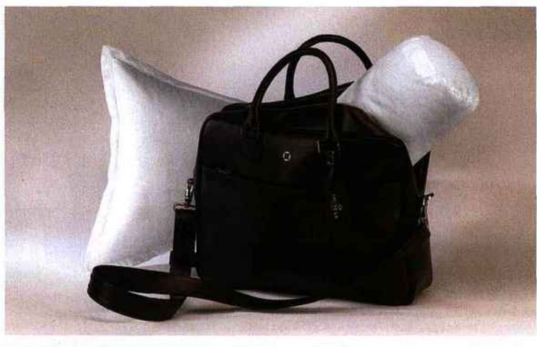
Nouvelle collection Vendu dans un sac de cuir marron italien élégant, cet « oreiller de voyage » en 70 % duvet, 30 % plumettes de canard neuf européen associe un cale-nuque du même type de garnissage.