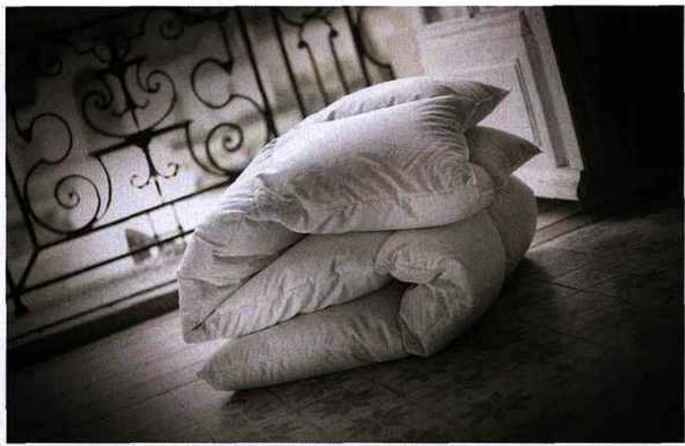
Couette duvet Eider Ce premier Millésime de l'enseigne assure une chaleur instantanée et régulée tout au long de l'année grâce à sa composition intégrant duvet de canard d'Eider.

C'est en 1880, à Paris, que la famille Dumas, originaire d'Auvergne débute son acti-